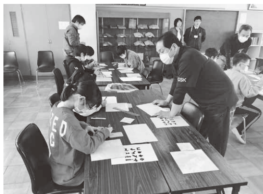
実技指導を行う組員

を行った後、塩ビタイル(フロアタイル)と化粧フィルムを使用した「パズル」の製作について実演を交えながら指導を行った。子供達は職人さんからの真剣な表情で「パズル」づくりに取り組んでいた。