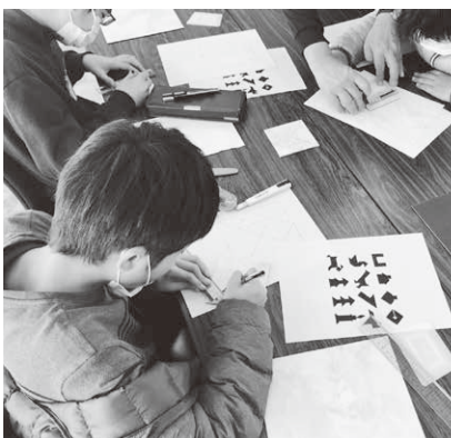
パズル作りに取り組む児童