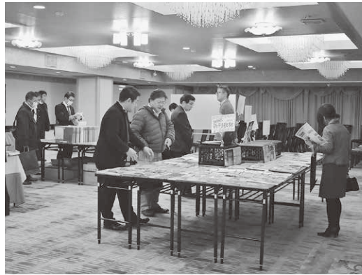
新刊教材を手に取る参加者

提供セミナーも行われた。会場には組合員のほか、組合員外の県下の学習塾経営者も多数会場を訪れ、教材を手にする姿が見られた。組合では、同イベントを通じて、組合のPRと共に、新規加入の促進も図っていく方針。