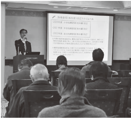
教材会社による情報提供セミナー

当日は、学習塾専門の教材販売会社3社が出席。新刊教材の展示のほか、学習指導要領の改訂や大学習試改革の動向についての情報