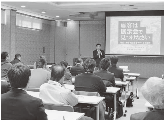
講師の話に熱心に耳を傾ける参加者

当日はクリエーターとしてSONY、サントリ、IBMをはじめとする大手企業の商品開発、広告・販促キャンペーンを成功に導