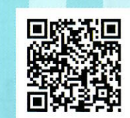
↑ホームページQRコード