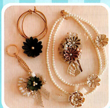
「つまみ細工アクセサリー」作品例 ブローチ・ペンダント・チャーム・ネックレス

45歳未満のわかものを対象に 19:00～20:30に講座を開催！ 初心者向けで気軽に参加できます。