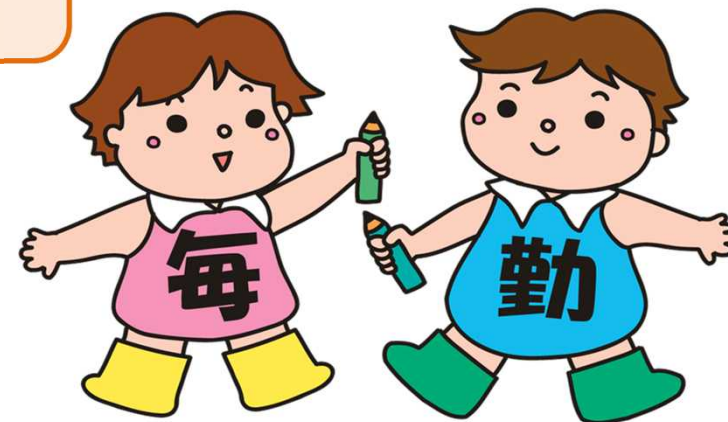
毎月勤労統計調査のキャラクター「まいちゃん きんちゃん」