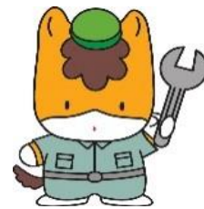
群馬県のマスコット「ぐんまちゃん」